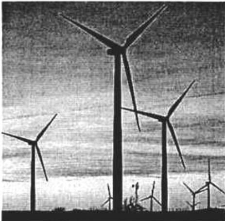
下院民主党は風力発電などによる電力供給の拡大も法案に盛りこんだ